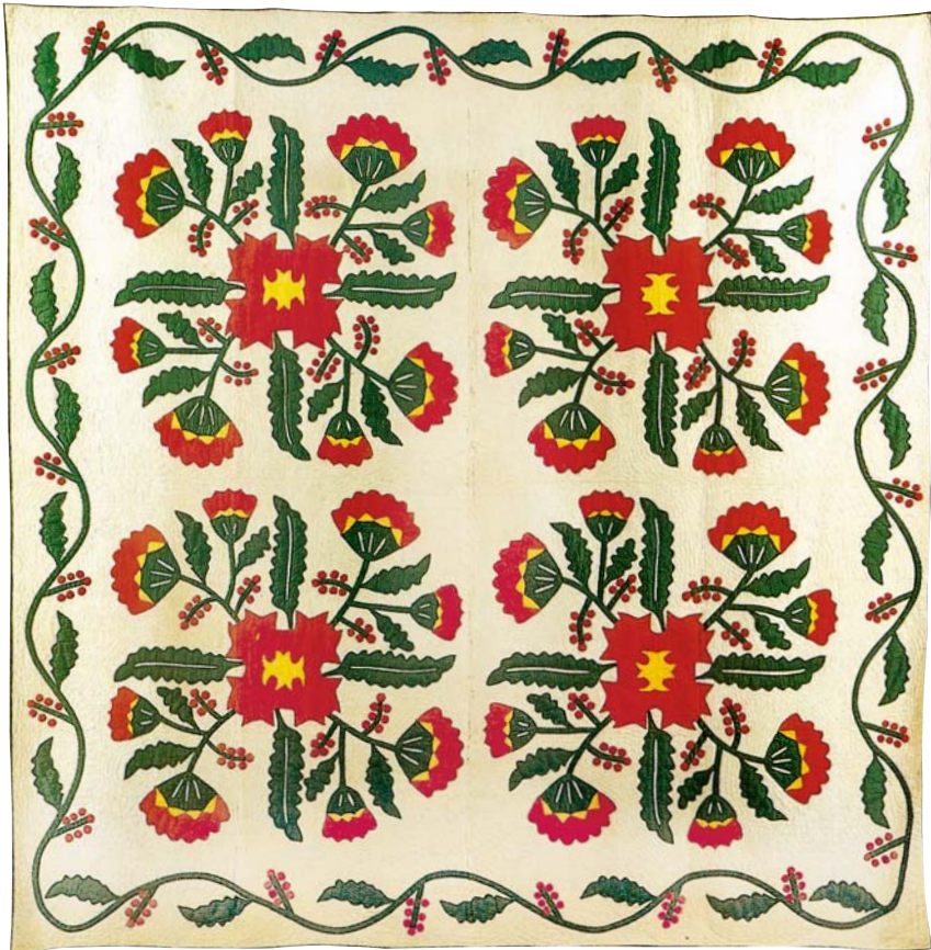
Cockscomb (Hahnenkamm), ca. 1850

Als die Mühsal der Siedler etwas nachließ, entwickelten die amerikanischen Quilts ihren eigenen einzigartigen Charakter. Man brauchte zwar immer noch warme Decken zum Schlafen, aber die Frauen konnten sich nun mit wenig Aufwand kreativ betätigen. Decken und Bettüberwürfe waren manchmal der einzige Schmuck in ihren Wohnungen. Die Umgebung war zum Teil trostlos und die Holzhütte primitiv