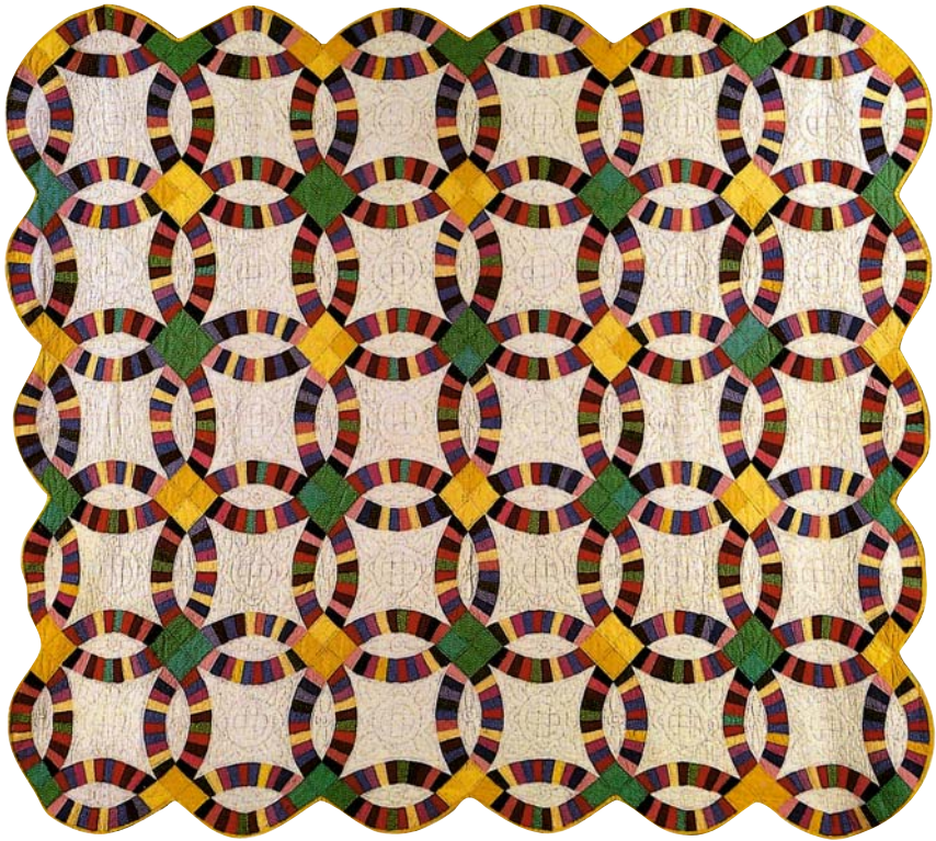
Double Wedding Ring (Doppelter Hochzeitsring), Midwestern Amish, ca. 1930

Lost Ship oder All around the World. Viele Muster waren gleich, änderten aber ihre Namen durch Entfernung, Politik oder auch Aberglauben. Einige Beispiele: Aus Carolina Rose wurde Prairie Rose; aus Job's Tears wurde Slave Chain oder aus Wandering Foot wurde Turkey Track. Namen von Rosen waren besonders beliebt. Es gibt unzählige, wie z. B. California Rose, Mexican Rose, Rose of Sharon, Democratic Rose usw.